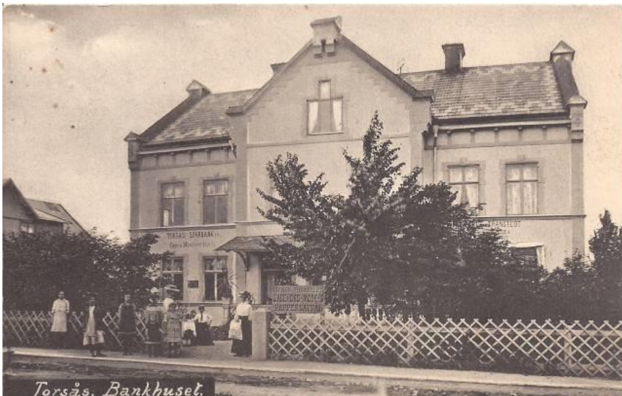
Bild 5. Bankhuset i Torsås i början av 1900-talet.