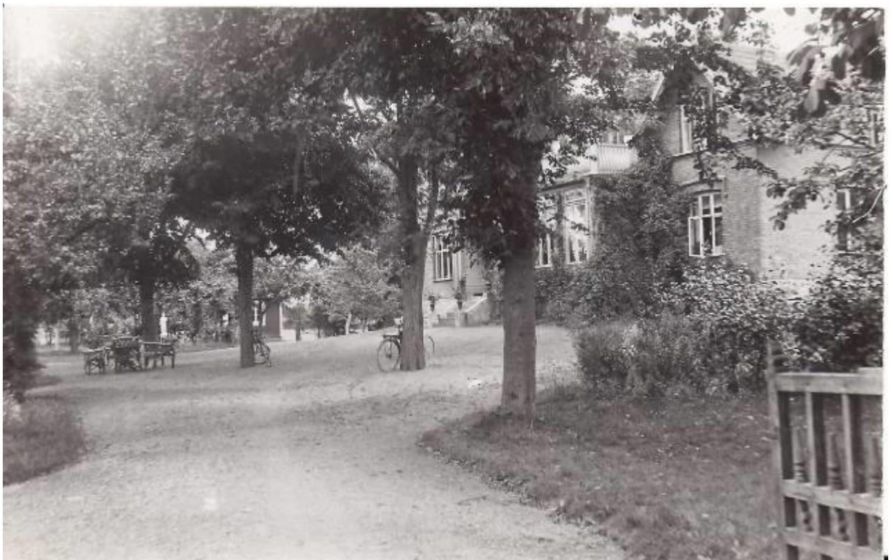
Bild 24. Detta hus kallas Ellebo och var landsfiskal Franzéns bostad.