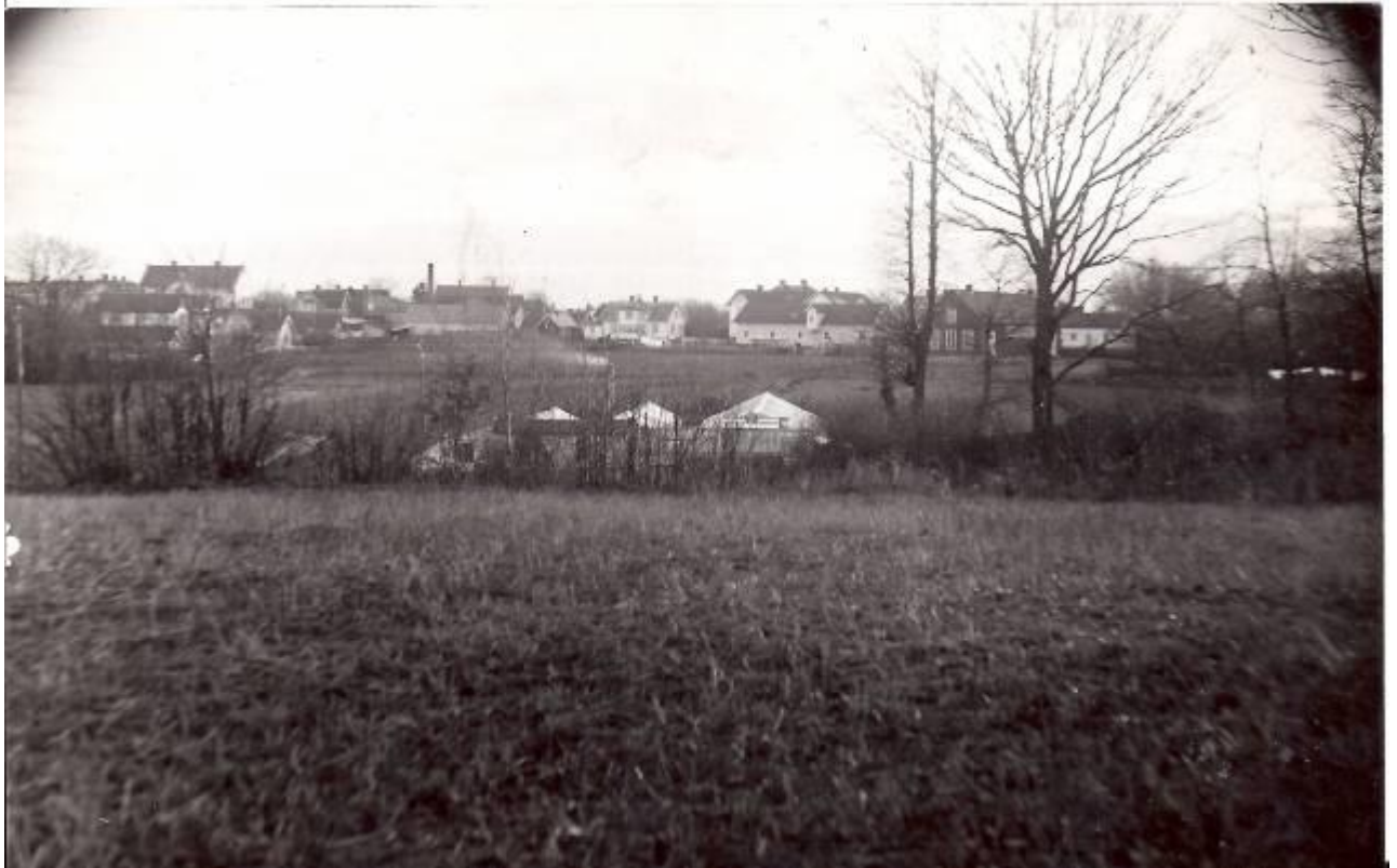
Bild 27. Vy över Torsås från Applerum.