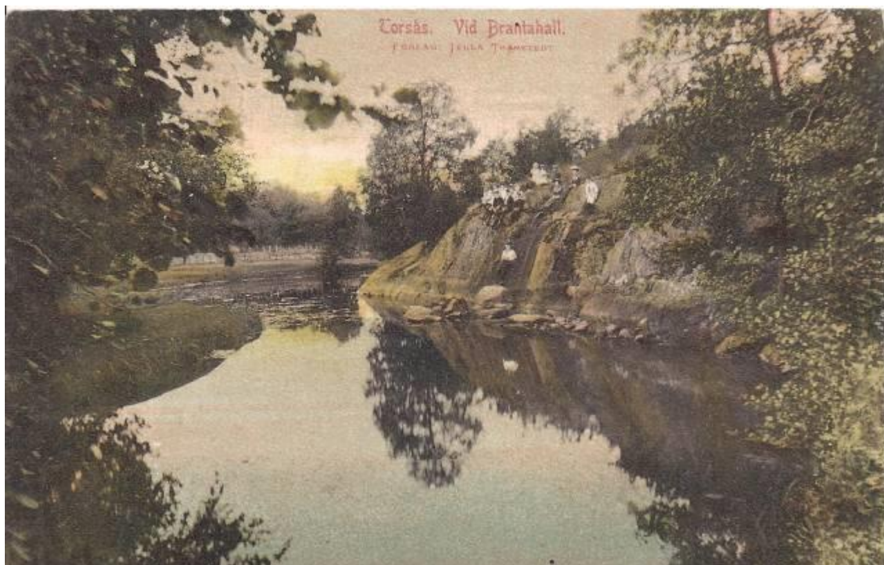
Bild 4. Brantehäll i början av 1900-talet.