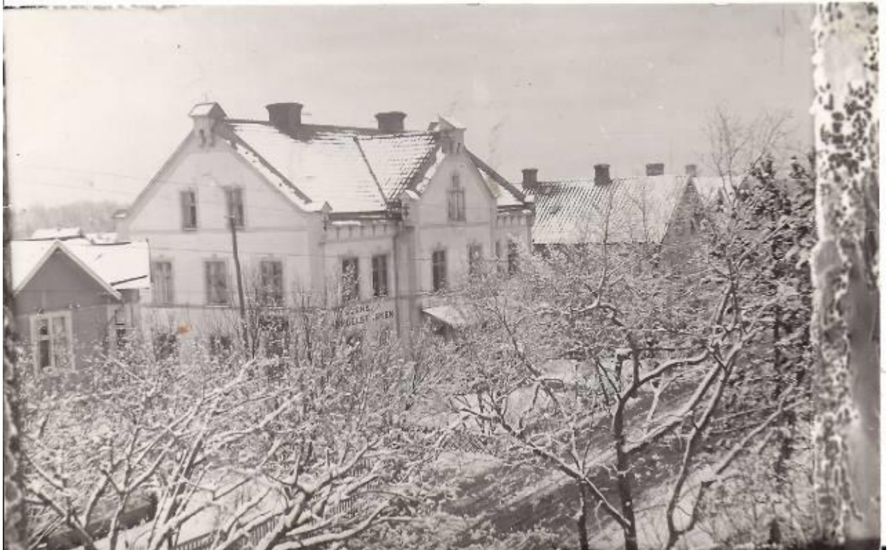
Bild 23. Svenska Handelsbanken.