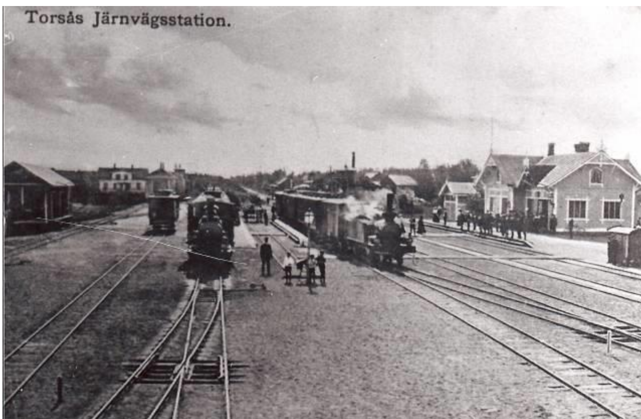
Bild 6. Järnvägsstationen i Torsås.