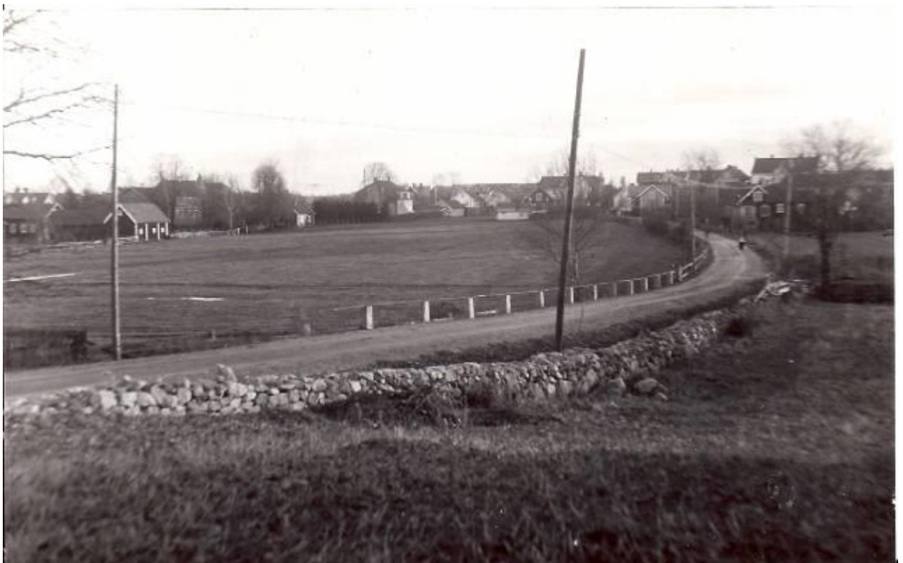
Bild 28. Vy över Torsås med gamla Applerumsgatan i förgrunden.