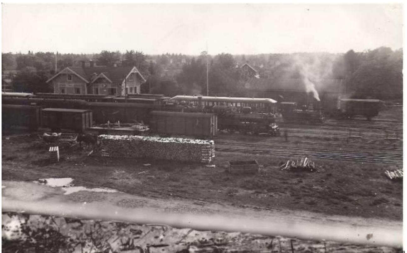
Bild 26. Torsås järnvägsstation 1929-30.