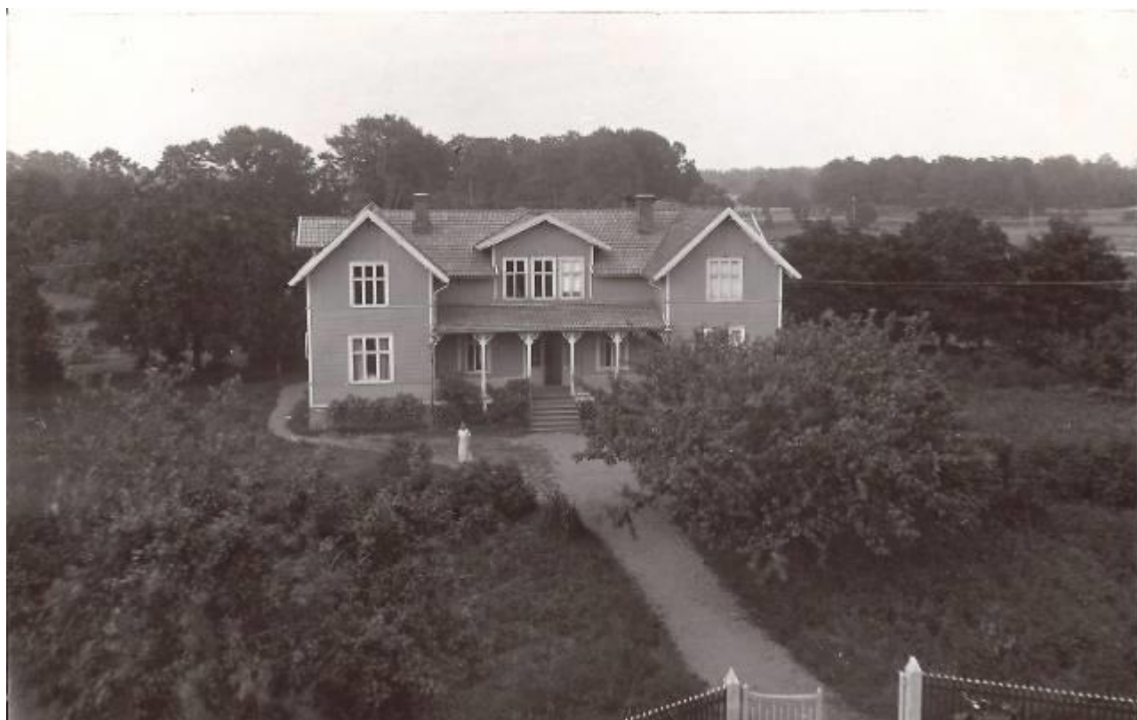
Bild 18. Lärarbostaden bakom gamla folkskolan i Torsås.