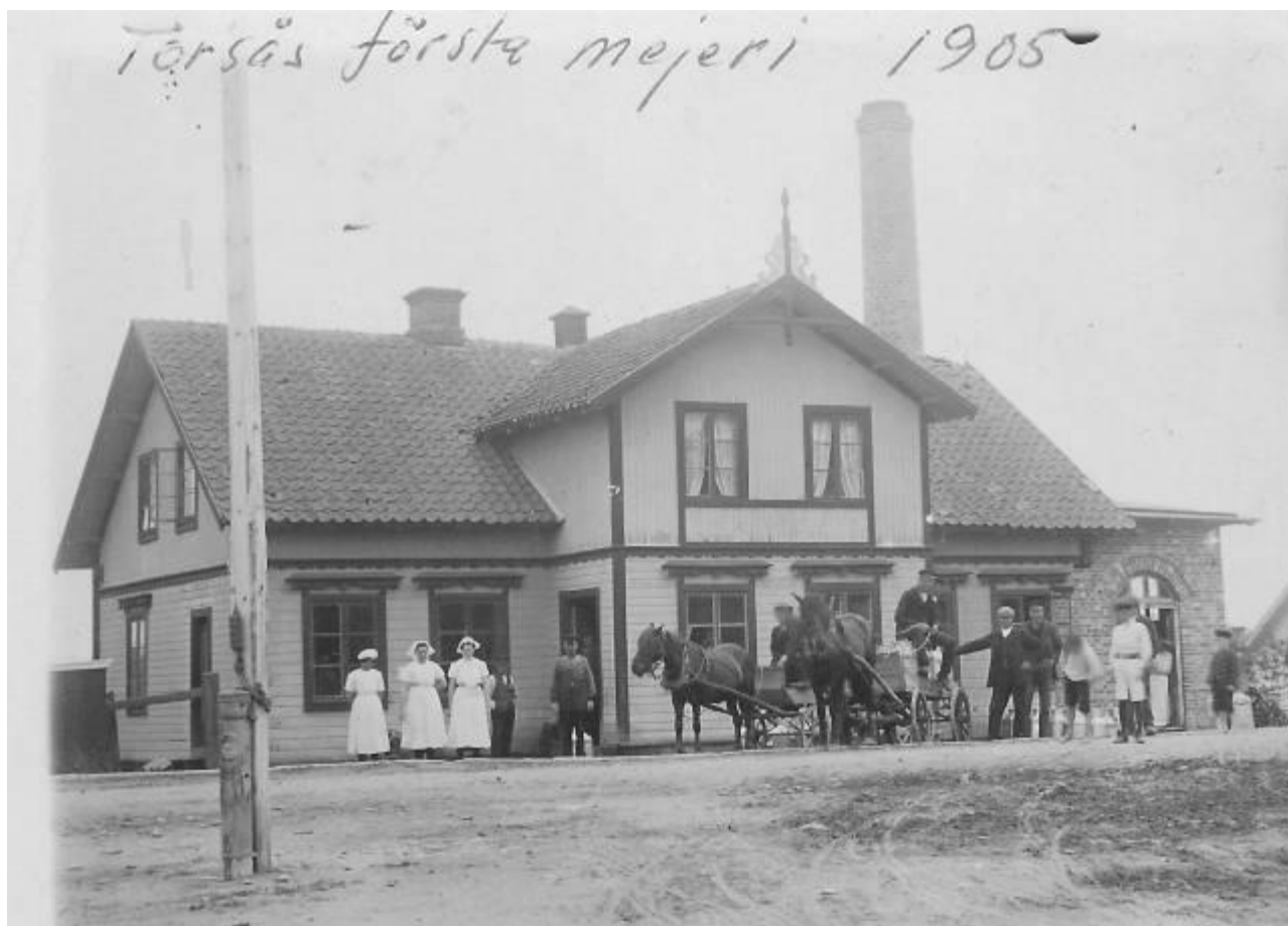
Bild 3. Torsås första mejeri 1905