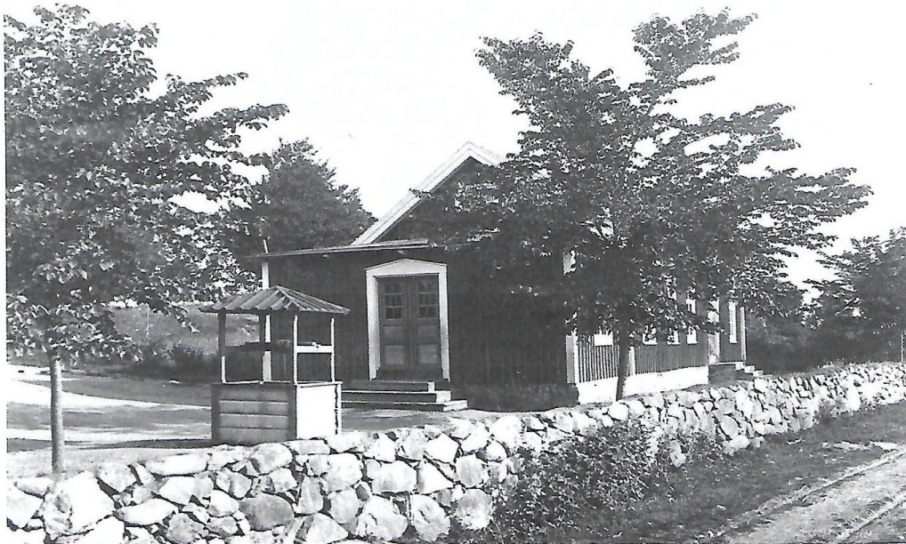
Gamla skolhuset i Slätafly, nuvarande församlingshem. 1920-talet.