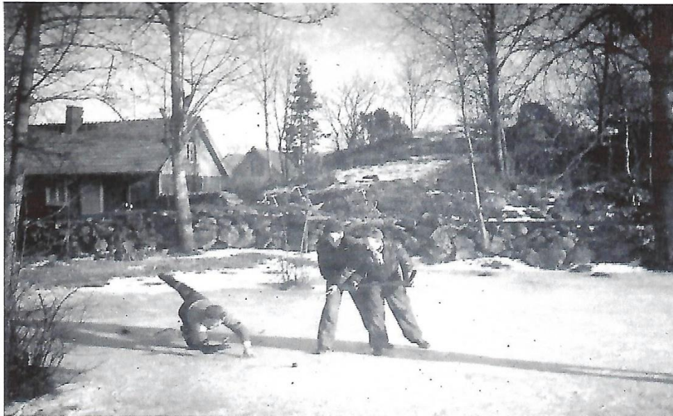
Bandymatch på dammen väster om Torvald Ohlssons affär i början av 50-talet. Gamla affären syns i bakgrunden mitt i bilden. Spelarna okända.