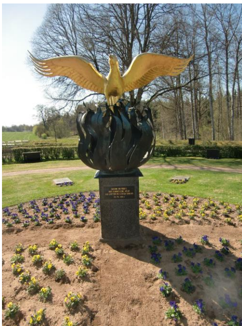
Den färdiga utsmyckningen "Fågel Fenix", som finns på Algutsboda kyrkogård