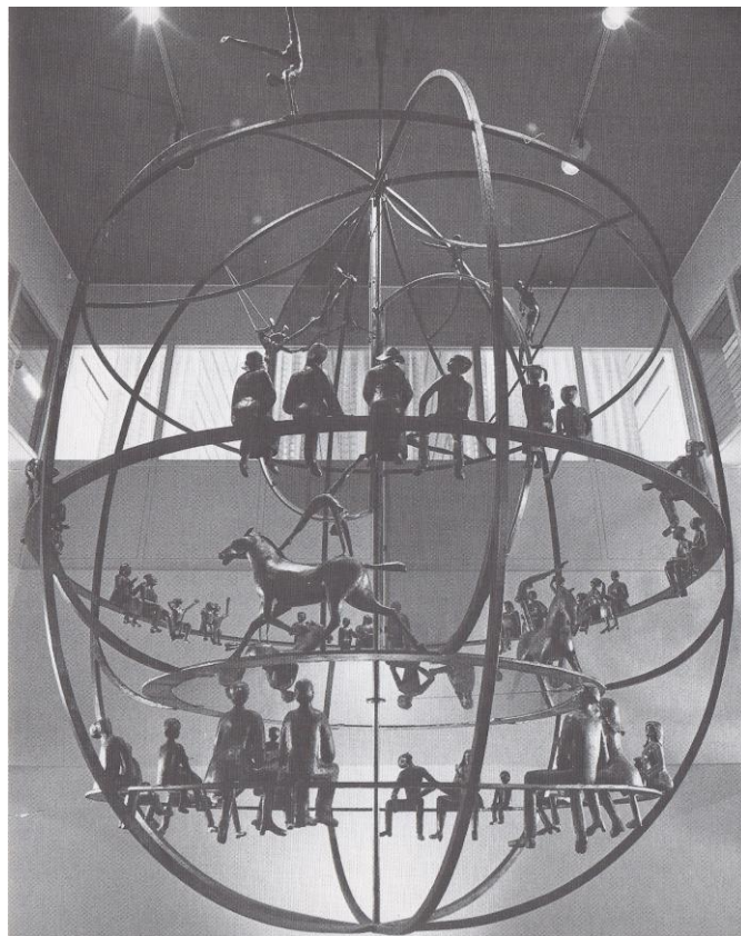
Detta är en 3 meter hög roterande utsmyckning, som finns i Kristianstad