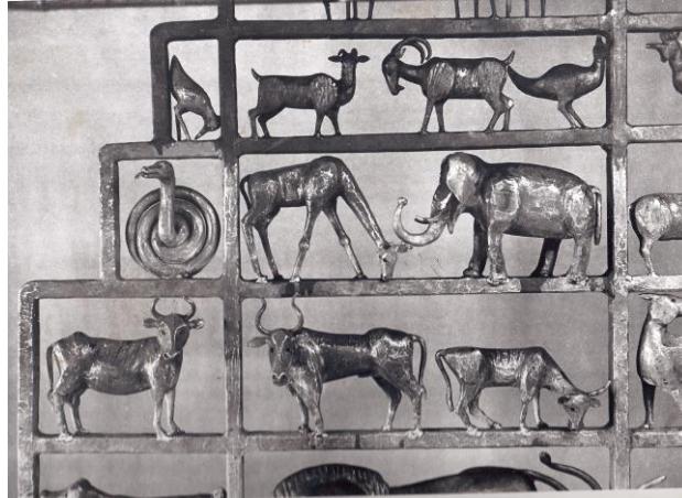
Axel älskade att smida djur och atleter som uppträdde